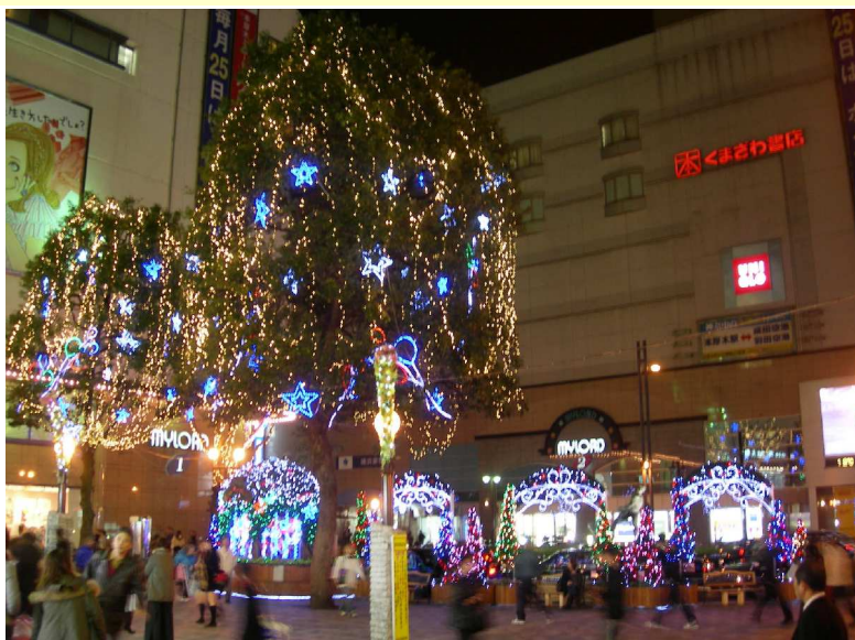
～ 本厚木駅 北口 ～

〒243-0004 厚木市水引1丁目9番14号 西迫会計事務所 電話 046(221)1328 FAX 046(224)2561 E-Mail 2435@nishisako-kaikei.co.jp ホームページ http://www.nishisako-kaikei.co.jp